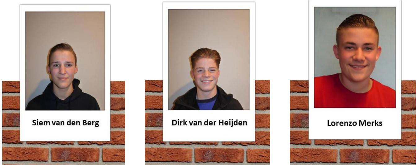
Drie finalisten uit Brabant

M. Gerritsen (communicatie) 026 – 384 56 41, gerritsen@knb-keramiek.nl