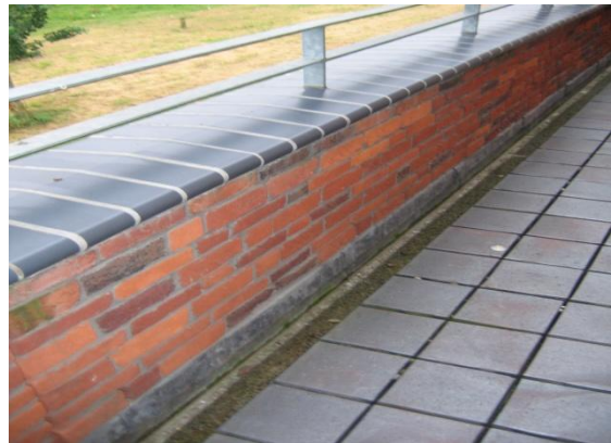
Binnenkant van borstwering die niet of nauwelijks nat wordt

Wanneer men er zeker van is dat het binnenblad van de borstwering nauwelijks nat zal worden is een waterkering tussen beide spouwbladen niet noodzakelijk. Voor de waterdichtheid van de aansluiting met het dak kan dan een loodslabbe worden ingemetseld, die de naad tussen dakbedekking en muur afdekt. Regenwater dat via het buitenspouwblad doorslaat zal net als bij het overige gevelmetselwerk via de luchtspouw zijn weg vinden naar de openstootvoegen ter plaatse van de waterkeringen.