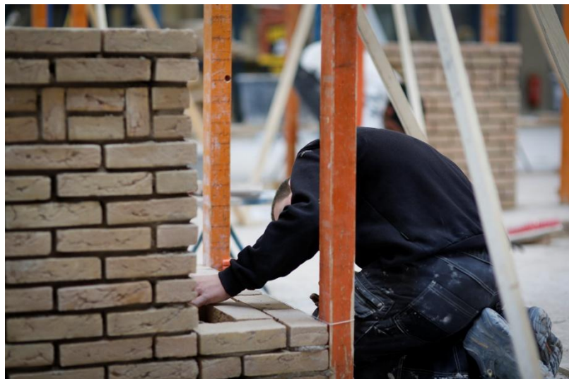
2: Deelnemer NK Metselen