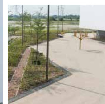
Goudgeel schelpenzand is aangebracht als knipoog naar de gouden medaille.