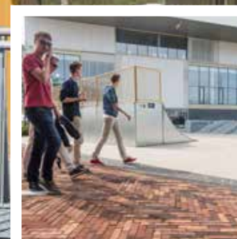
Geel in de baksteenmix laat het plein her en der oplichten.